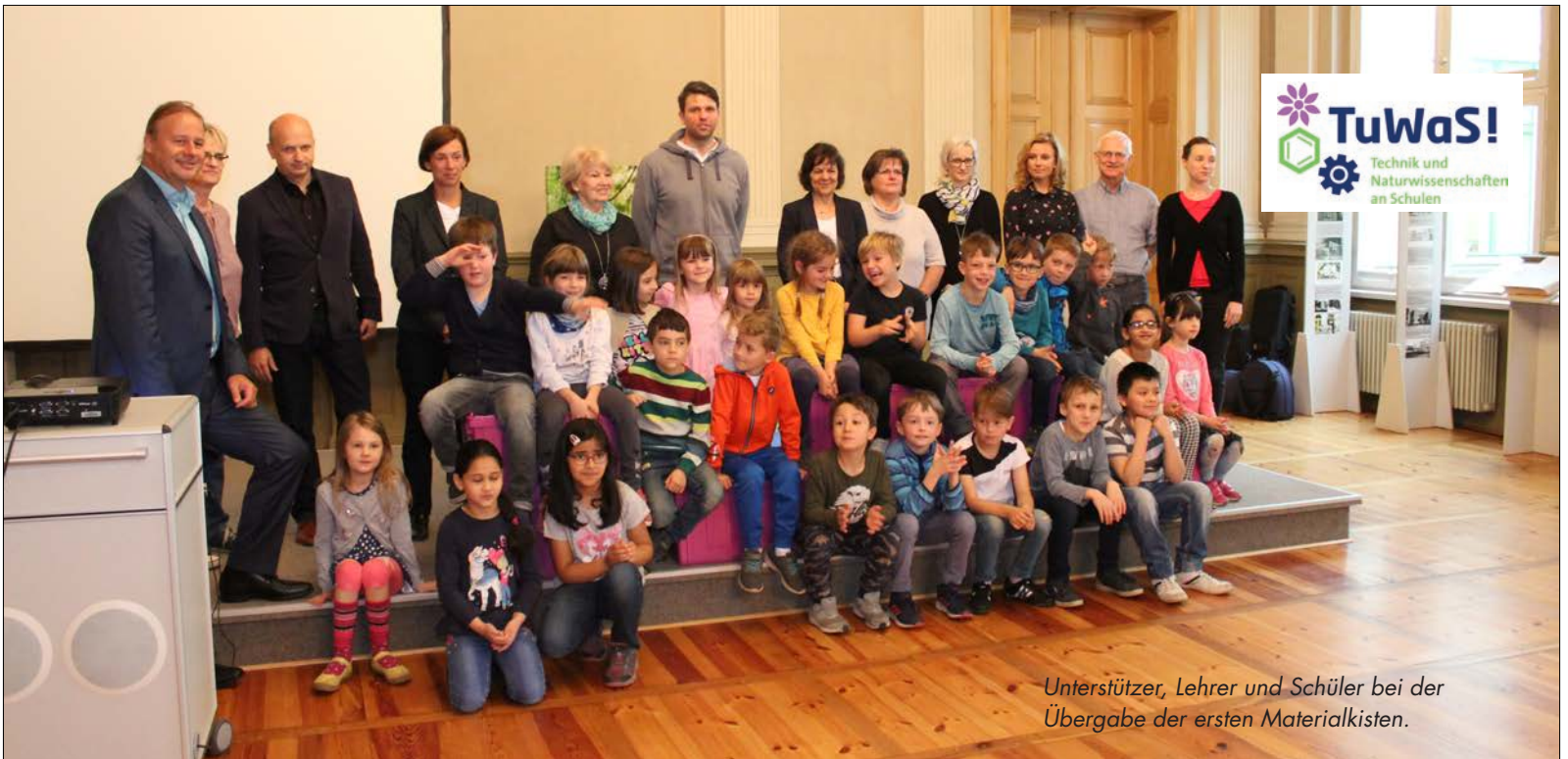
Unterstützer, Lehrer und Schüler bei der Übergabe der ersten Materialkisten.