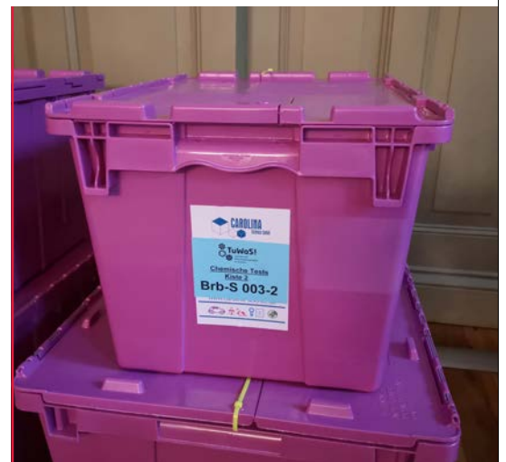
Kiste mit Experimentiermaterial

Eine Initiative, um Grundschüler für Naturwissenschaft, Mathematik und Informatik sowie Technik zu begeistern.