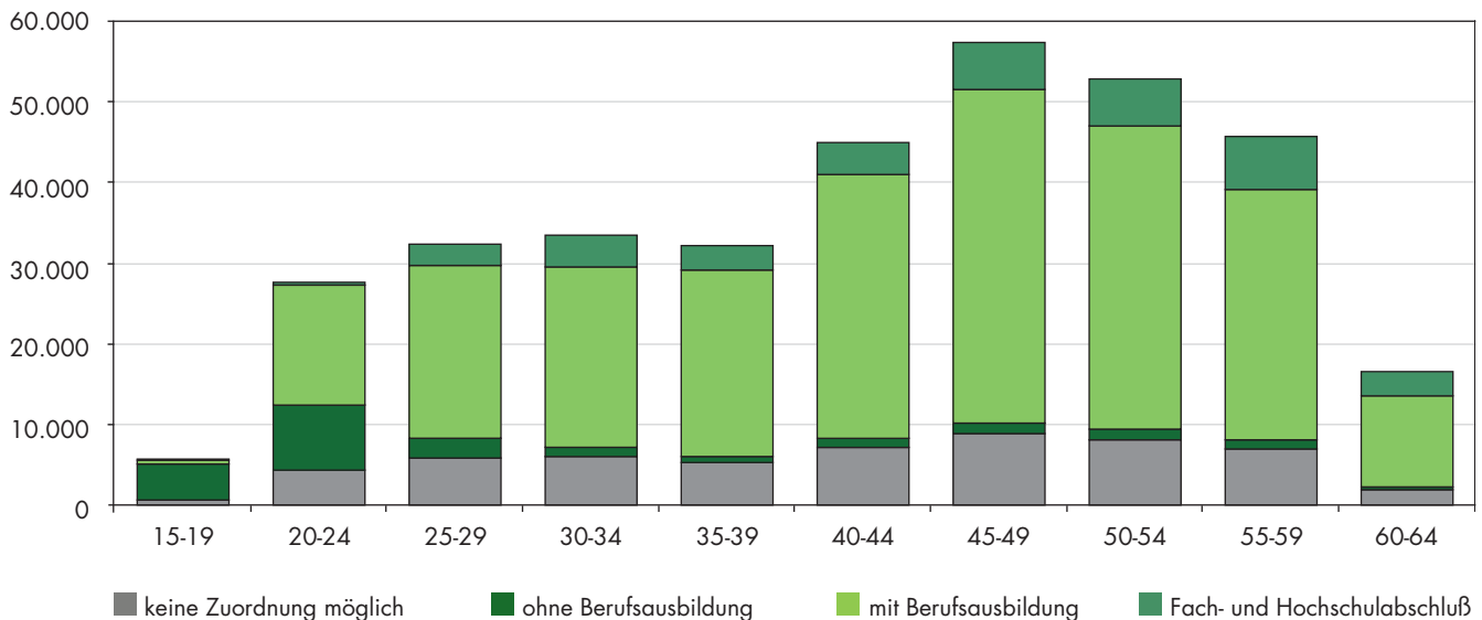
Altersverteilung und Qualifikationen der sozialversicherungspflichtig Beschäftigten in der Lausitz 2011

Die Fachkräfteentwicklung in der Lausitz spitzt sich weiter zu. Der Rückgang der Lausitzer Erwerbspersonen zwischen 2010 und 2030 wird mit 36% deutlich stärker ausfallen als in der gesamten Bundesrepublik (8%). Die Qualifizierungsstrategie muss dahingehend ausgerichtet werden, dass nicht nur Schüler bei der Berufs- und Studienwahl stärker unterstützt werden, sondern auch bereits im Beruf tätige Mitarbeiter verstärkt die Möglichkeit zur Weiterqualifizierung erhalten. Die Lausitz hat dafür eine gute Ausgangslage: Der Anteil der Beschäftigten ohne eine Ausbildung ist in der Lausitz halb so hoch wie im gesamten Bundesgebiet (13,5 %). Die Anzahl derer, die eine Ausbildung oder einen Abschluss an einer Berufsfach- oder Fachschule erworben haben, liegt in der Lausitz mit 67 % knapp 10 Prozentpunkte über dem deutschlandweiten Wert.